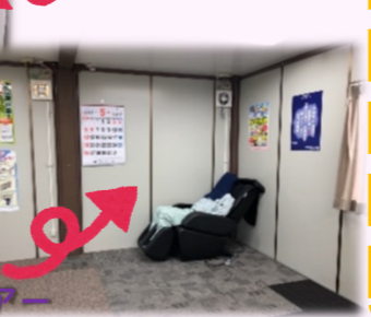
○マッサージチェア